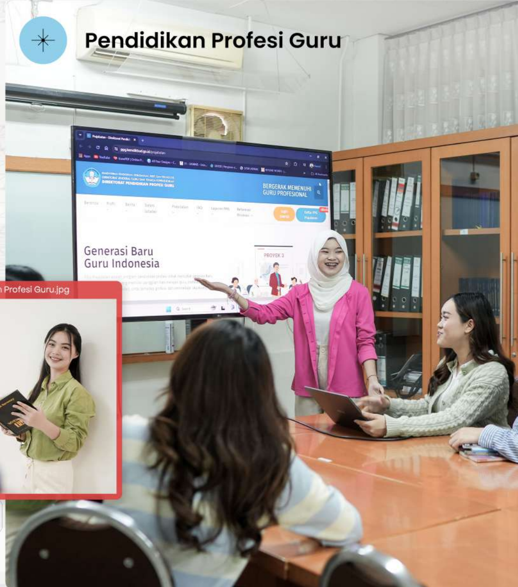
Pendidikan Profesi Guru.jpg